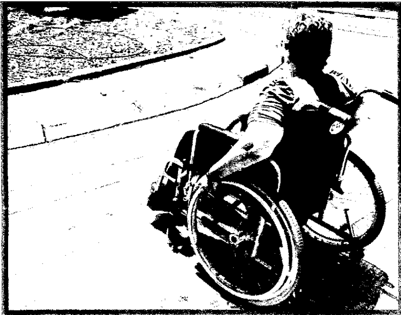
(תצלום אילוסטרציה של נכה אחר)